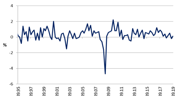
BDP u Njemačkoj, tromj.promj.