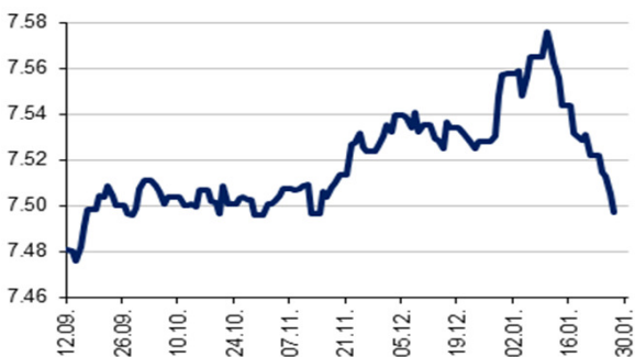
EUR/HRK srednji tečaj