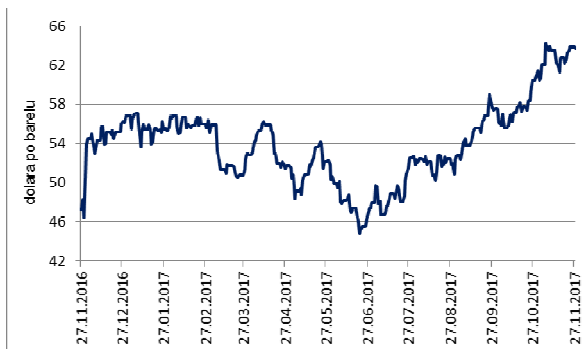
Cijene nafte tipa Brent, isporuke sljedeći mjesec