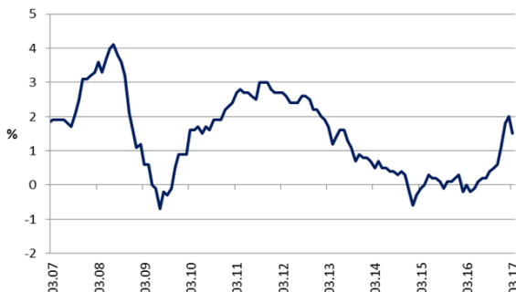
Potrošačke cijene u eurozoni, god. promjena