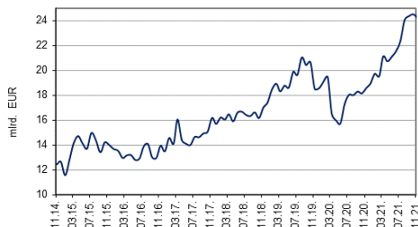
Bruto međunarodne pričuve

Svi pokazatelji adekvatnosti bruto međunarodnih pričuva Hrvatske (odnos pričuva prema uvozu robe i usluga, prema kratkoročnom dugom (prema preostalom dospjeću) te monetarnim agregatima upućuju i dalje na zaključak da su one dostatne za nesmetano vođenje monetarne politike središnje banke. E.S. Resanović, Z.Ž. Matijević