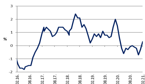
Potrošačke cijene, godišnja promjena